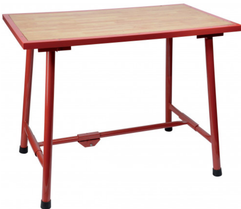
Table pliante pour plombier