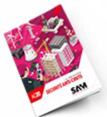
Sécurité anti-chute 2020