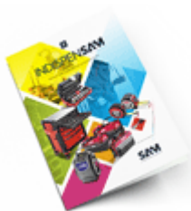
Les outils Indispensables SAM 2021

Découvrez tous nos produits dans nos catalogues en ligne