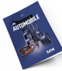
Automobile 2021 Consulter le catalogue