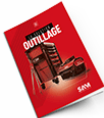
Outils 2021 Consulter le catalogue