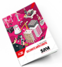
Sécurité anti-chute 2020 Consulter le catalogue