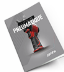
Pneumatique 2021 Consulter le catalogue