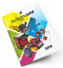
Les outils Indispensables SAM 2021 Consulter le catalogue