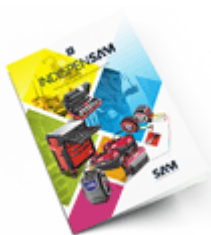
Les outils Indispensables 2021

Découvrez tous nos produits dans nos catalogues en ligne