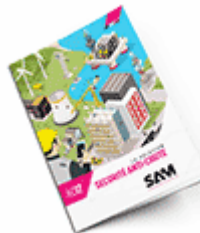
Sécurité anti-chute 2019