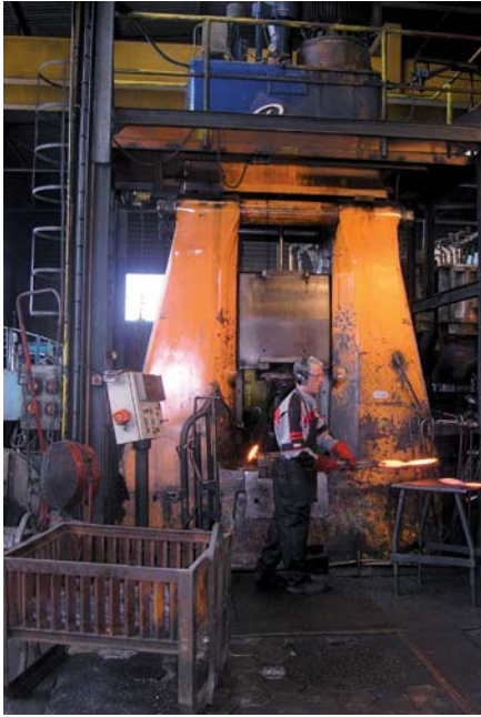
Cinq aspects de l'usine de Sam Outillage avec de la forge, de l'usinage, le traitement thermique, l'atelier d'assemblage et le laboratoire.