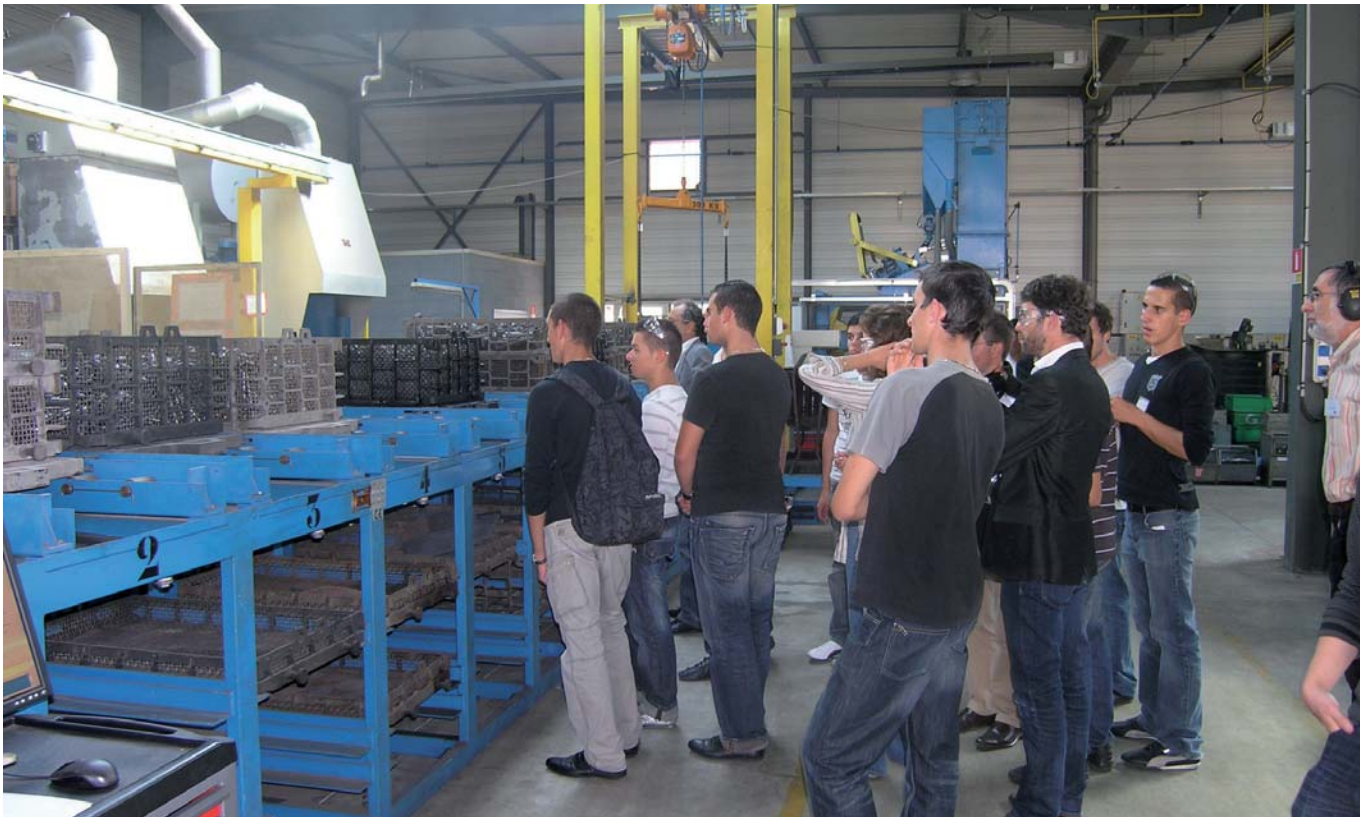
Les élèves du lycée Jean Mimard de Saint Etienne (Terminale STI génie mécanique, Terminale STI génie des matériaux, BTS 1 ère année en conception des produits industriels) étaient invités à visiter l'usine de Sam Outillage. Nous retrouvons ici une partie des étudiants devant la chaîne de tremp automatisée de l'industriel stéphanois.

P our une fois, un événement a rassemblé en un seul lieu tous les acteurs du monde industriel, depuis les élèves et leurs enseignants jusqu'aux industriels consommateurs d'outillage, en passant par le fabricant, le distributeur et les politiques de la région. Cette manifestation a eu lieu le mardi 8 septembre dernier sur le site de Sam Outillage, à St Etienne, où le fabricant d'outils à main a reçu, en partenariat avec son distributeur Outilacier, les élèves du lycée technique Etienne Mimard (St Etienne) et des représentants de haut rang de plusieurs grandes entreprises françaises, sans oublier plusieurs personnalités politiques de la région.